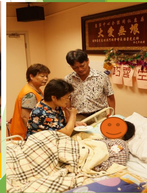
到康寧中心為會員慶生，送上祝福