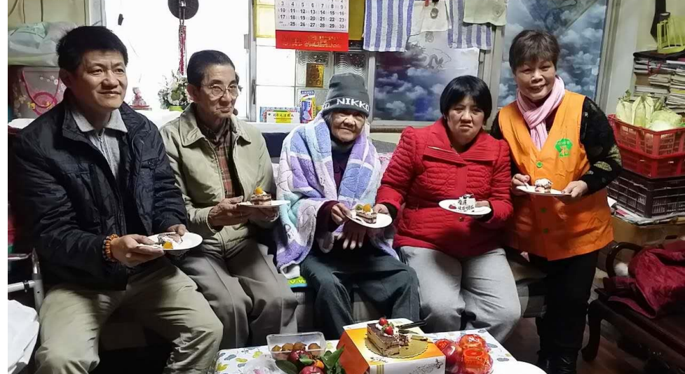
到會員居所進行生日會