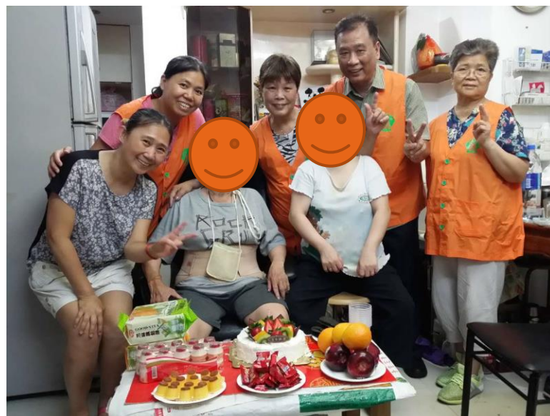
到會員居所進行生日會