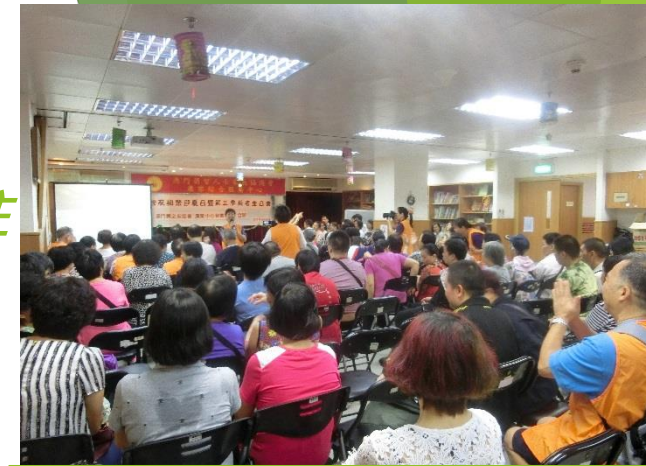
智友相聚迎夏日暨第三季長者生日會