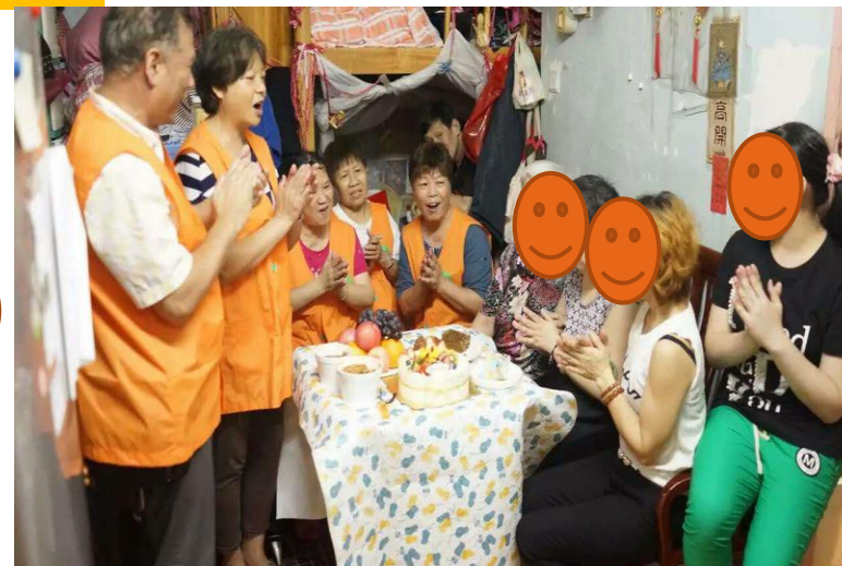
到會員居所進行生日會