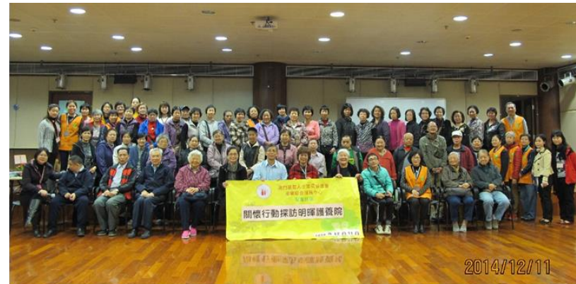
關懷探訪活動 - 參訪長者護老中心